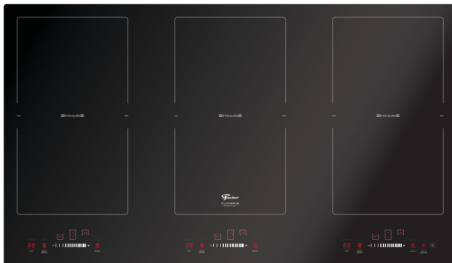
MODELO 30640-78283 (SOMENTE EM 220V)

O Fogão Cooktop Fischer por indução está aliado ao que é de mais recente em tecnologia no mercado. O princípio de funcionamento, parte da geração de um campo eletromagnético que aquece instantaneamente apenas a panela posicionada no local indicado, atingindo altas temperaturas em poucos segundos. Essa tecnologia, permite mais segurança e agilidade na cozinha. Com controle touch screen (sensível ao toque), mesa vitrocerâmica, 3 zonas Smartzone, trava de segurança, timer individual, função manter aquecido, função pausar, 9 níveis de potência e função Booster. Possui ainda sistema indicador de superfície quente e sensor de panela.