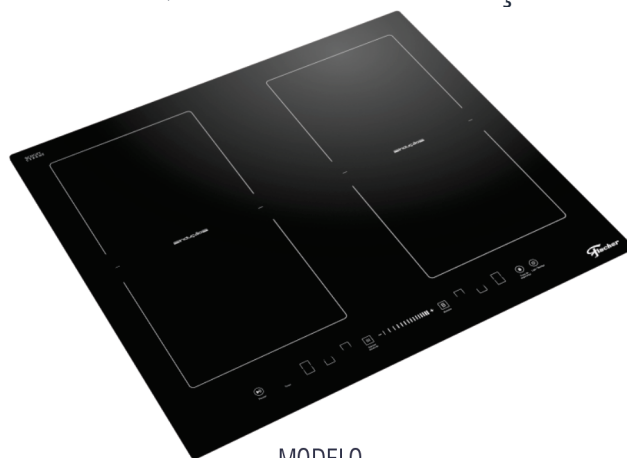
MODELO 29850-71205 (SOMENTE EM 220V)

Descubra um novo conceito de cozinhar, conheça o que há de mais recente em tecnologia de cocção: Fogão Cooktop Fischer Smartzone por Indução 4Q.