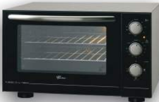
MODELO 26573-58033 (127V) 26573-58032 (220V)

Uma das linhas mais tradicionais da Fischer recebe um novo modelo: o Forno Elétrico Fischer Turbo 2.4 New de bancada 48L. O novo modelo é turbo e possui programação de três funções que otimizam o tempo de preparo dos alimentos: Grill Dourador /, Air Convection Turbo e Air Fryer.