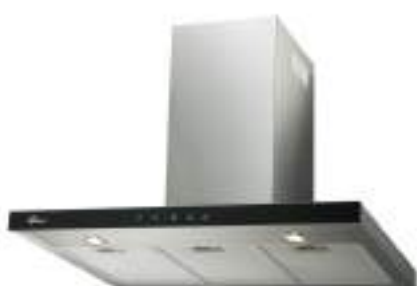
MODELO PRETO 19902-22549 (127 V) 19902-22550 (220 V)