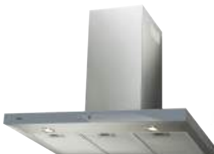
MODELO EIGER 19902- 82061 (127 V) 19902- 82060 (220 V)