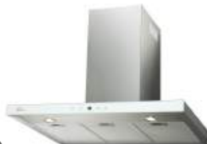
MODELO BRANCO 19902-22551 (127 V) 19902-22552 (220 V)

Cada vez mais, os eletrodomésticos são projetados para tornar o espaço da cozinha além de funcional, mais requintado.